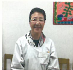
薬剤師インタビュー：長島さん

○日々のお仕事の中で、大切にしていることを教えてください 薬剤師として、相手のためになること、人の役に立つことをポリシーにしています。例えば高齢の患者様なら、今まで生きてきた歴史があり、物語があります。患者様のお話をよく聞いて、どんなお手伝いをするのが患者様のためになるのかを、よく考えて行動しています。患者様は病気をしているので、多くの方は気分が落ち込んでいます。そのため、少しでも明るい気分になっていただきたくて、お会いした患者様には何かの形で、1回は笑っていただけるように心がけています。